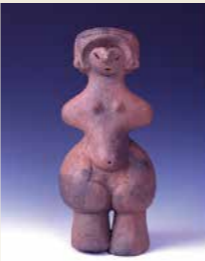
【国宝】縄文のビーナス

国宝「土偶」(縄文のビーナス)、国宝「土偶」(仮面の女神)など、ハケ岳山麓の縄文文化を堪能できます。